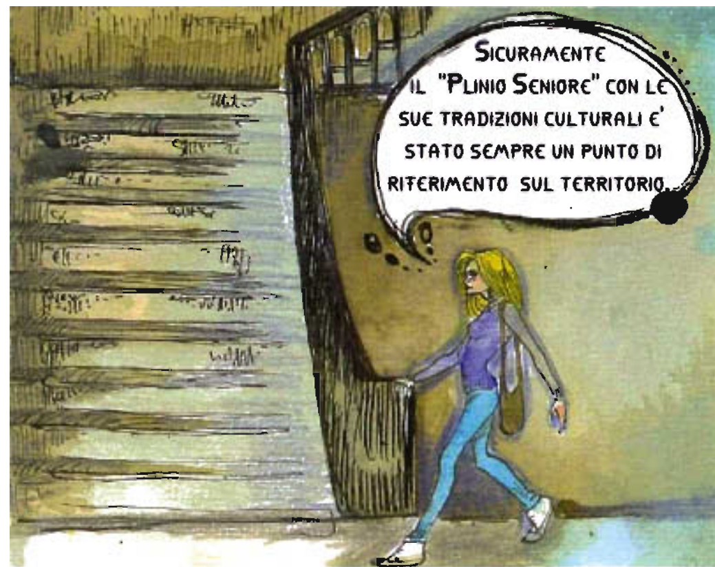
Breve storia del "PLINIO SENIORE"

Il Liceo Classico "Plinio Seniore" nasce come Liceo pareggiato nell'ottobre del 1918, con 34 alunni. Negli Esami di Stato dell'a.s. 1918/1919 i quattro candidati alla licenza furono tutti promossi. Come si evince dalla Relazione del Regio Commissario, Prefetto Muffone, al Consiglio Comunale del 1920, l'affluenza degli alunni ed il profitto della scolaresca furono garanzia dell'ulteriore sviluppo del nuovo istituto.